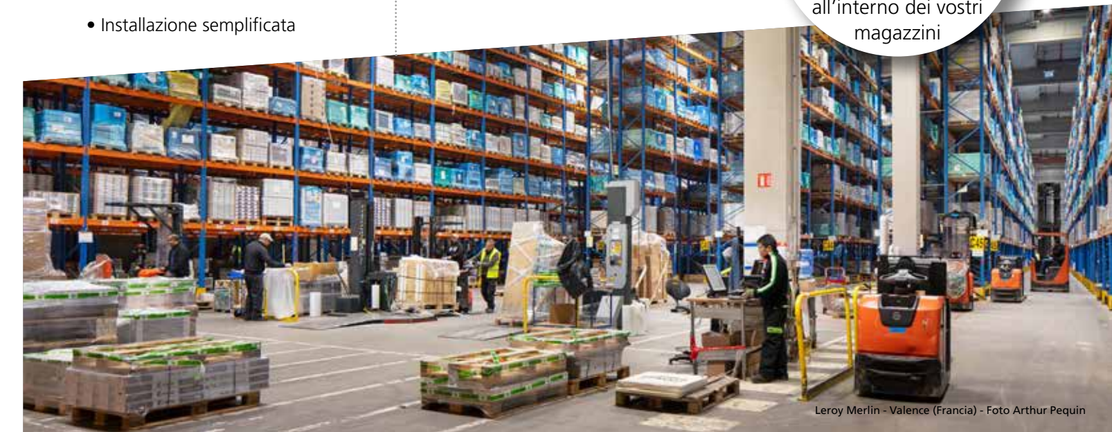
Leroy Merlin - Valence (Francia) - Foto Arthur Pequin

Assicurate il COMFORT visivo per una maggiore PRODUTTIVITÀ e SICUREZZA all'interno dei vostri magazzini